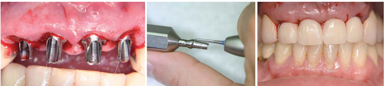
Abb. 8: Titanabutments für die provisorische Versorgung in situ. – Abb. 9: Beschleifen der Titanabutments für die provisorische Versorgung mithilfe des Halters. – Abb. 10: Provisorische Versorgung mittels verblockten Kronen direkt nach Implantation.

Nach der Modellation der individuellen Abutments unter ästhetischen und optimal prothetischen Gesichtspunkten in Kunststoff wurden diese mittels CAD/CAM-