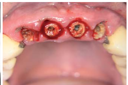
Abb. 1: Ausgangsbefund der Patientin. – Abb. 2: OPG der Ausgangssituation. – Abb. 3: Situation nach Entfernung der alten Kronen.