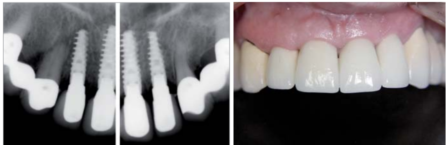
Abb. 14: Röntgenologische Kontrolle drei Monate nach Implantation. – Abb. 15: Klinische Situation ein Jahr nach Implantation.

Eine Extraktion und Sofortversorgung in der ästhetischen Zone ist in manchen Fällen eine sinnvolle Behandlungsmöglichkeit. Wichtig in diesem Zusammenhang ist die entsprechende Selektion der Fälle. Entscheidend hierbei sind der Erhalt der vestibulären Knochenlamelle und ein ausreichendes apikales Knochenangebot, damit eine sichere Implantatverankerung möglich wird. Darüber hinaus sollten keine akuten Entzündungen vorliegen. Im Falle chronischer Entzündungsprozesse, wie im beschriebenen Fall, wird eine antibiotische Behandlung einen Tag vor und fünf Tage nach dem Eingriff empfohlen. Für die Sofortversorgung ist eine ausreichende Primärstabilität Voraussetzung. Für die Einheilzeit werden die Implantate durch das Provisorium primär verblockt.