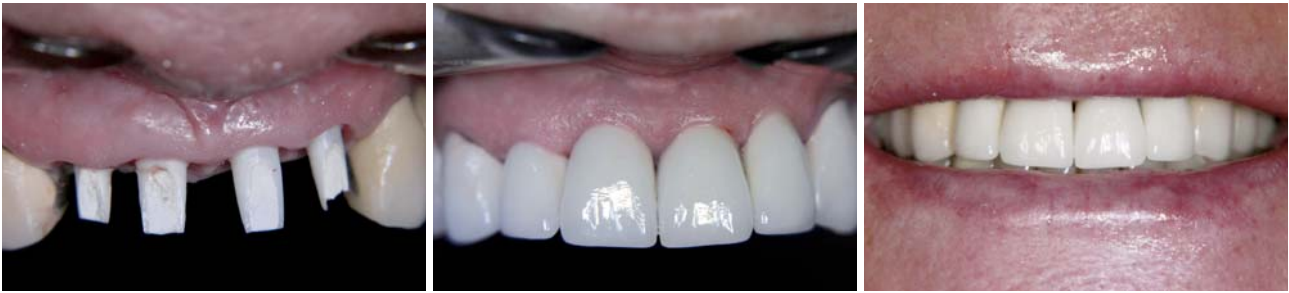
Abb. 11: Individuelle NobelProcera Zirkoniumdioxidabutments in situ mit Kontrolle der Lage des Kronenrandes. – Abb. 12: Die definitive Kronenversorgung. – Abb. 13: Wiederherstellung eines ästhetischen Lächelns.

Technik gescannt und in Zirkoniumdioxid überführt. Die Bissregistrierung wurde mittels Zentrik-Registrierat, Gesichtsbogen und Clinometer vorgenommen. Die Anprobe der individuellen Abutments erfolgte in einer separaten Sitzung (Abb. 7). Dabei wurde der Kronenrand der späteren prothetischen Versorgung, der zirkulär 0,5–1 mm unterhalb des Gingivaes liegend sein sollte, überprüft und gegebenenfalls korrigiert.