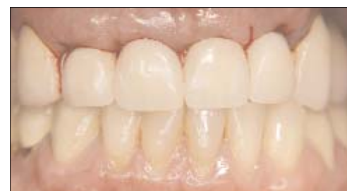
Abb. 8: Titanabutments für die provisorische Versorgung in situ. – Abb. 9: Beschleifen der Titanabutments für die provisorische Versorgung mithilfe des Halters. – Abb. 10: Provisorische Versorgung mittels verblockten Kronen direkt nach Implantation.