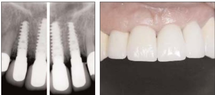
Abb. 14: Röntgenologische Kontrolle drei Monate nach Implantation. – Abb. 15: Klinische Situation ein Jahr nach Implantation.

Entscheidend hierbei sind der Erhalt der vestibulären Knochenlamelle und ein ausreichendes apikales Knochenangebot, damit eine sichere Implantatverankerung möglich wird. Darüber hinaus sollten keine akuten Entzündungen vorliegen. Im Falle chronischer Entzündungsprozesse, wie im beschriebenen Fall, wird eine antibiotische Behandlung einen Tag vor und fünf Tage nach dem Eingriff empfohlen. Für die Sofortversorgung ist eine ausreichende Primärstabilität Voraussetzung. Für die Einheilzeit werden die Implantate durch das Provisorium primär verblockt. Das spezielle Schraubendesign als auch die hohe Primärstabilität des NobelActive Implantats erlauben in vielen Fällen die Beschleunigung der prothetischen Versorgung. Oftmals ist es möglich, sofort nach Extraktion zu implantieren, weil die Implantate mit ihren selbstschneidenden Gewinden sehr präzise platziert werden können, ohne in Achsrichtung und Position durch die vorhandenen Alveolen