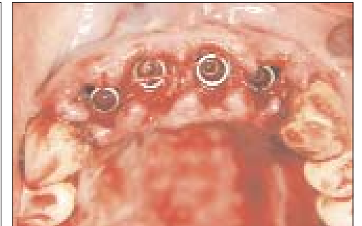
Abb. 4: Nach palatinal angulierte Bohrung. – Abb. 5: Inserieren des Implantats mittels der manuellen Einbringhilfe. – Abb. 6: Die nach palatinal ausgerichtete Angulation verhindert die apikale Perforation der vestibulären Knochenlamelle. – Abb. 7: Intraoperatives Bild der gesetzten Implantate.

sorium. Zuvor erfolgte eine gründliche Reinigung und Deep Scaling der Zähne sowie eine Mundhygieneschulung. Die Patientin wurde aufgeklärt über die notwendigen Maßnahmen postoperativ, Spülen mit CHX-Spüllösung sowie Auftragen von CHX-Gel und die fünftägige Antibiotikaeinnahme.