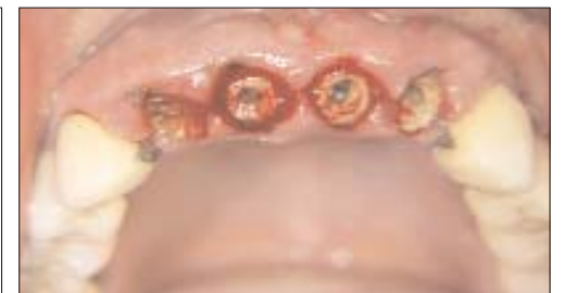
Abb. 1: Ausgangsbefund der Patientin. – Abb. 2: OPG der Ausgangssituation. – Abb. 3: Situation nach Entfernung der alten Kronen.