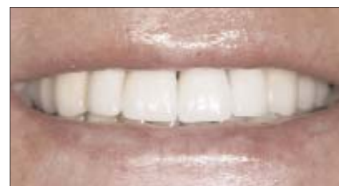
Abb. 11: Individuelle NobelProcera Zirkoniumdioxidabutments in situ mit Kontrolle der Lage des Kronenrandes. – Abb. 12: Die definitive Kronenversorgung. – Abb. 13: Wiederherstellung eines ästhetischen Lächelns.

BOP. Aus den Fistelgängen entleerte sich Pus. Die Zähne hatten einen Lockerungsgrad von 1–2. Aufgrund ihres endodontischen